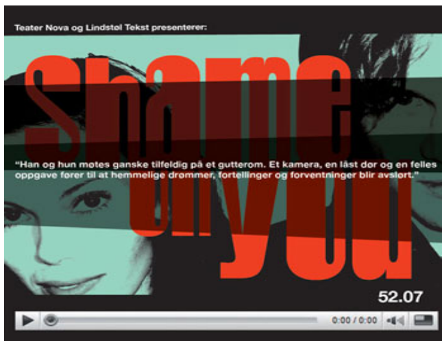
Illustrasjon 2: Fra forsiden på programmet til teaterforestillingen og undervisningsopplegget: «Shame on you».